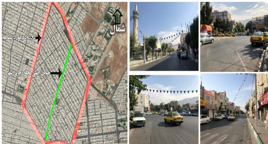
تصویر ۱: محدوده و مسیر پیاده خیابان اصلی منطقه رجایی شهر کرج

این پژوهش به روش پیمایشی، عکس برداری با استفاده از ابزار پرسشنامه انجام شده است. در این پژوهش برای محاسبه حجم نمونه از فرمول کوکران استفاده گردید. حجم جامعه آماری در این پژوهش متشکل از ساکنین بوده که با توجه به جامعه ساکن در محدوده، مشاهدات جزئی-موردی و نمونه گیری غیر احتمالی با حجم نمونه ۳۲۰ نفر به دست می آید که در بخش اول به منظور سنجش میزان تاثیر عوامل جامعه‌شناختی بر کاهش جرم در طراحی محیطی پیشگیرانه از جرم، از نمودار مفهومی و توسط نرم افزار «اس.پی.اس.اس» و با استفاده از تحلیل رگرسیون چند متغیره مورد تجزیه و تحلیل قرار گرفت. در پرسشنامه ۳۵ سؤال به صورت واضح و شفاف از افراد حاضر در محدوده پرسش گردید. روش تحلیل در این پژوهش به دو صورت است: در بخش اول ماهیت داده ها با استفاده از آنالیز چند متغیره مورد سنجش قرار می گیرد. این امر سبب شناسایی همبستگی های میان متغیر وابسته و متغیرهای مستقل می شود. پایایی شاخص های مورد انتخاب با استفاده از روش ضریب آلفای کرونباخ انجام شده که برای شاخص های بالا مقدار آلفای کرونباخ ۰/۸۰۹ است که به دلیل این که از ۰/۷ بیشتر است، نشان از پایایی شاخص ها و مشکل ساز نبودن آن دارد. در بخش دوم سؤالات به منظور دریافت میزان ارتباط عوامل کالبدی و جامعه‌شناختی در فضاهای شهری از فن افتراق معنایی استفاده شده است. این روش توسط چارلز آزگود و همکاران ۱ (۱۹۵۷) برای سنجش شخصیت افراد و احساس آن‌ها از پدیده‌های پیرامونی است (ساروخانی، ۱۳۹۳: ۵۳). در این پژوهش محله رجایی شهر کرج با تراکم جمعیتی و با مساحتی در حدود ۱۹۰ هکتار انتخاب شد. طول مسیر پیاده در خیابان اصلی منطقه، برابر با ۱۸۰۰ متر می باشد.